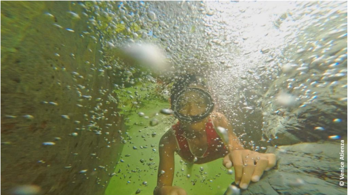
Reyboy unter Wasser in "Last Days At Sea".

deshalb nach Manila, um dort zu arbeiten.