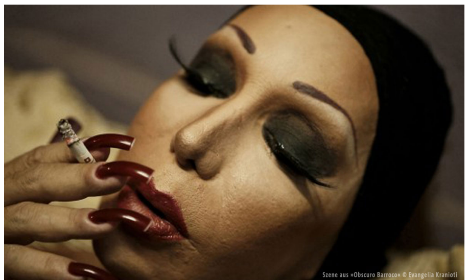
Szene aus »Obscuro Barroco«

Die Form eines magischen Essayfilms wählte die in Paris lebende Griechin Evangelia Kranioti für ihre Produktion »Obscuro Barroco« über Rio de Janeiro. Sie arbeitet ebenfalls als Fotografin und Videokünstlerin und will in ihrem Film den Kern der