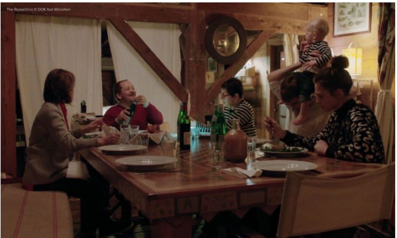
Filmstill aus "The Rossellinis"