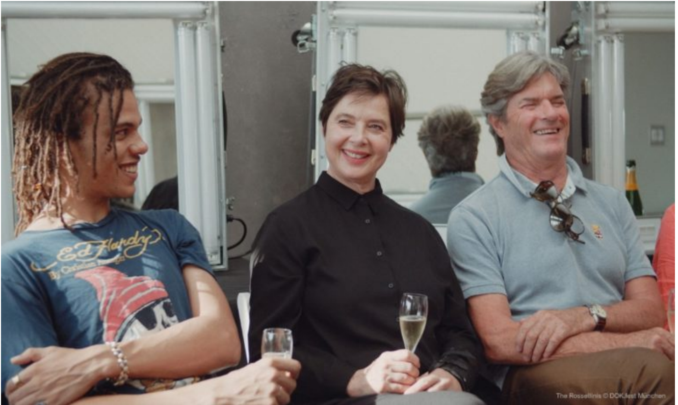
Filmstill aus "The Rossellinis"