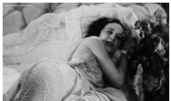
Filmstill aus "Doomed"

In Hollywood war er sehr erfolgreich mit Spielfilmen wie „Hair“ (1979) oder „Ragtime“ (1981). Für „Einer flog über das Kuckucksnest“ (1975) und „Amadeus“ (1984) gewann er jeweils einen Academy Award. In dem für Filmfans spannenden Porträt hat Helena Treštíková seine Geschichte nahezu chronologisch angelegt mit vielen Interviews aus unterschiedlichen Quellen sowie Ausschnitten und Making-of-Material. Er scheint immer ein Getriebener gewesen zu sein. Forman starb 2018, also kurz vor Fertigstellung des Dokumentarfilms.