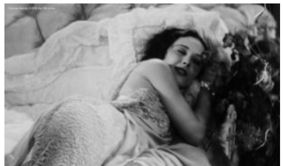
Filmstill aus "Doomed"

In Hollywood war er sehr erfolgreich mit Spielfilmen wie „Hair“ (1979) oder „Ragtime“ (1981). Für „Einer flog über das Kuckucksnest“ (1975) und „Amadeus“ (1984) gewann er jeweils einen Academy Award. In dem für Filmfans spannenden Porträt hat Helena Treštíková seine Geschichte nahezu chronologisch angelegt mit vielen Interviews aus unterschiedlichen Quellen sowie Ausschnitten und Making-of-Material. Er scheint immer ein Getriebener gewesen zu sein. Forman starb 2018, also kurz vor Fertigstellung des Dokumentarfilms.