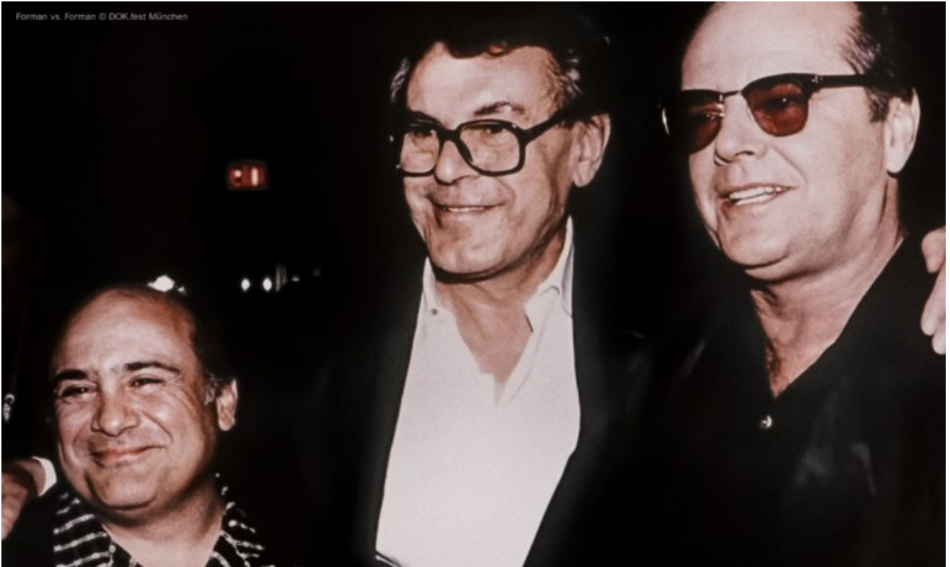
Filmstill aus "Forman vs. Forman"