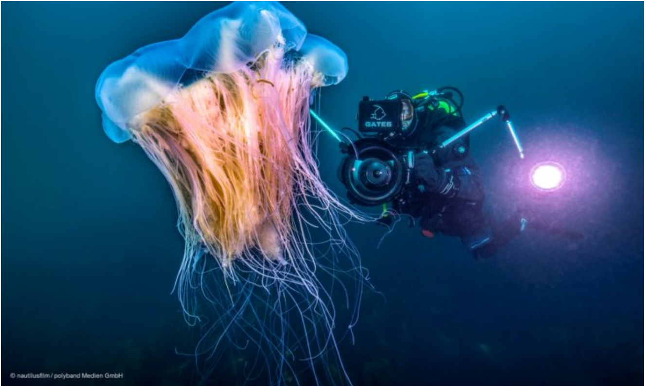
Feuerqualle. Filmstill aus "Heimat Natur"