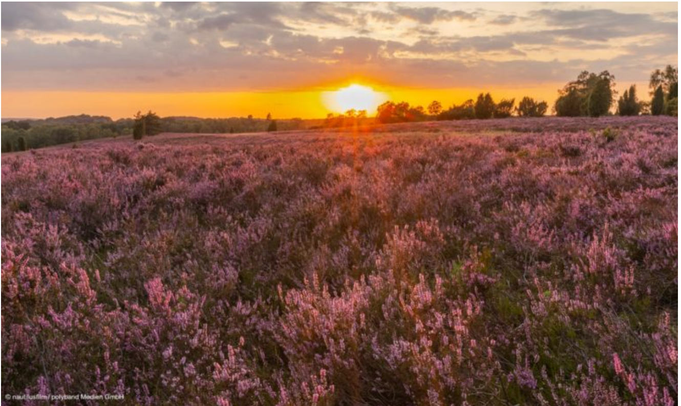
Lüneburger Heide. Filmstill aus "Heimat Natur"

Mit dem Kinostart erscheint das gleichnamige Buch „Heimat Natur“ im Penguin Verlag. Der Biologe und preisgekrönte Naturfilmer Jan Haft lenkt darin unseren Blick auf das unscheinbare Detail genauso wie auf das große Ganze der heimischen Natur und führt uns ihren Wert, ihre Schönheit und ihre Gefährdung vor Augen.