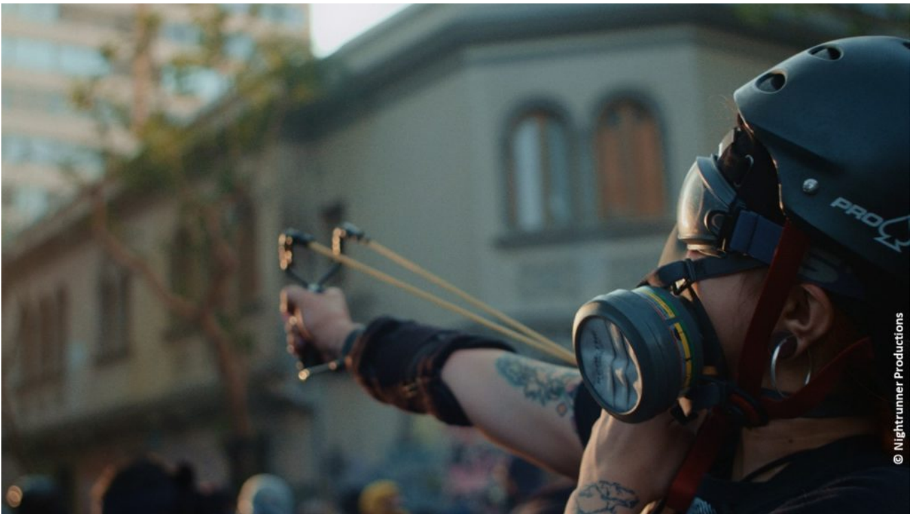
Verletzte Aktivistin aus Chile.