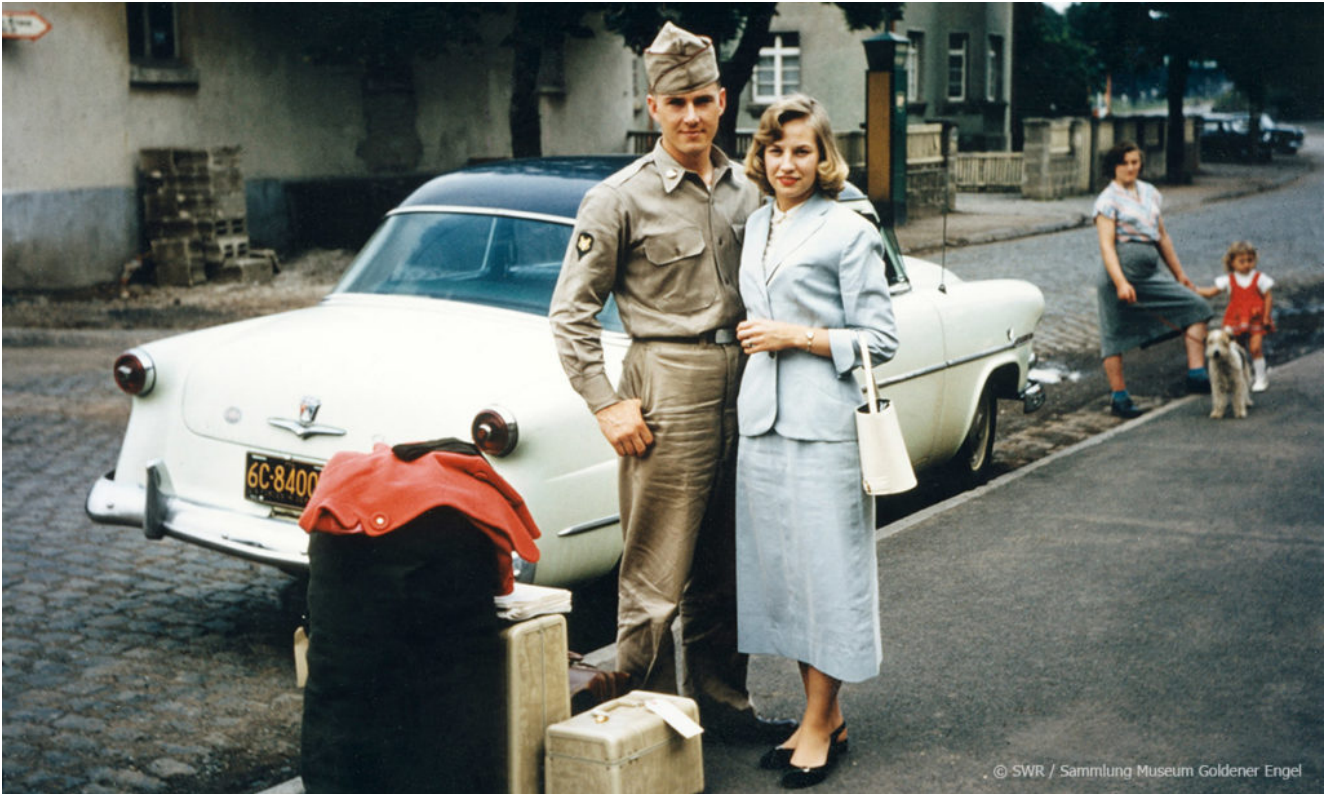
Archivbild: US-amerikanischer Soldat in Deutschland