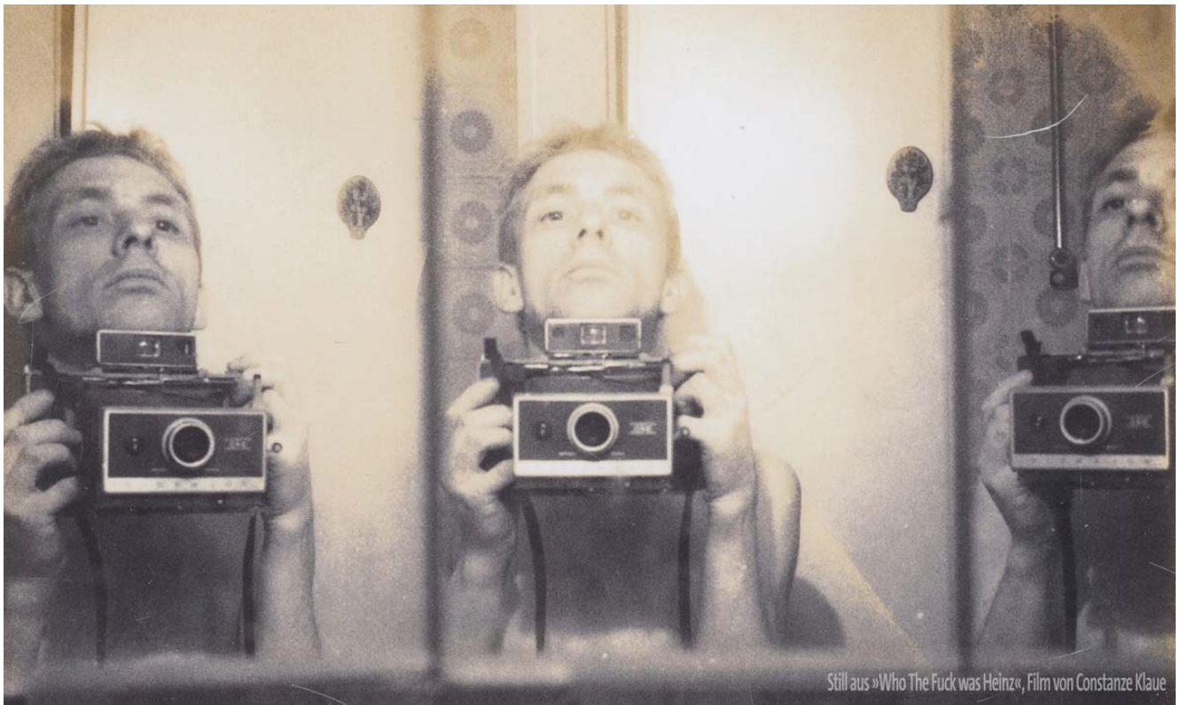
Still aus »Who The Fuck Was Heinz«, Film von Constanze Klaue