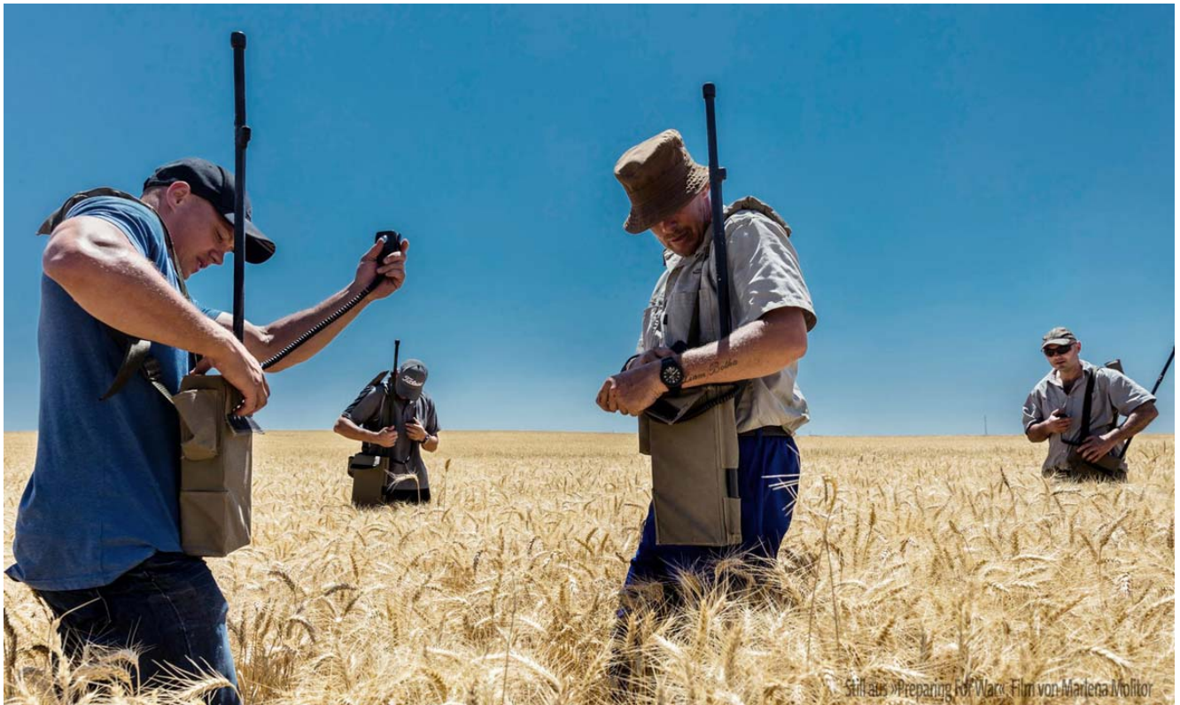
Still aus »Preparing for War«, Film von Marlene Mollter