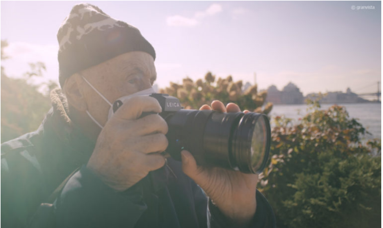
Thomas Hoepker mit seiner Kamera...