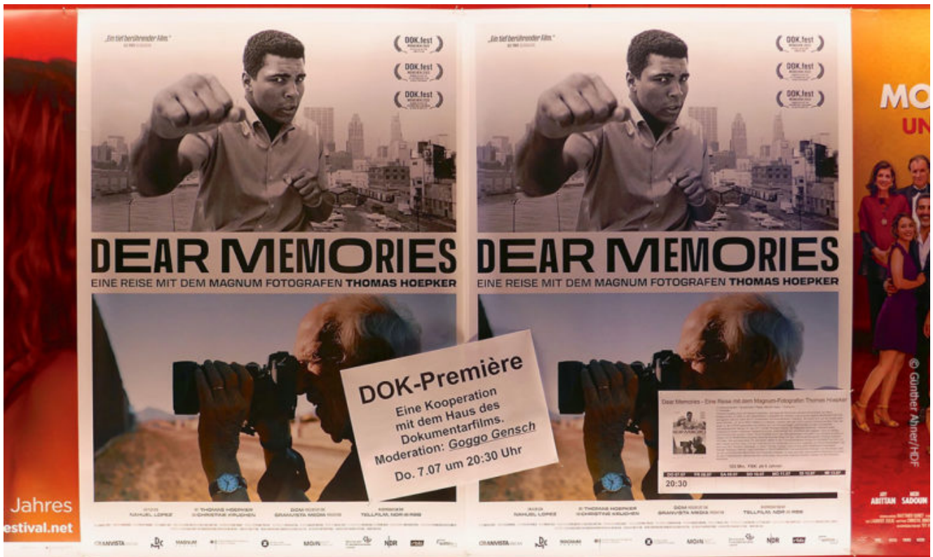
Plakat zur DOK Premiere „Dear Memories“ im Arthaus Kino Delphi Stuttgart