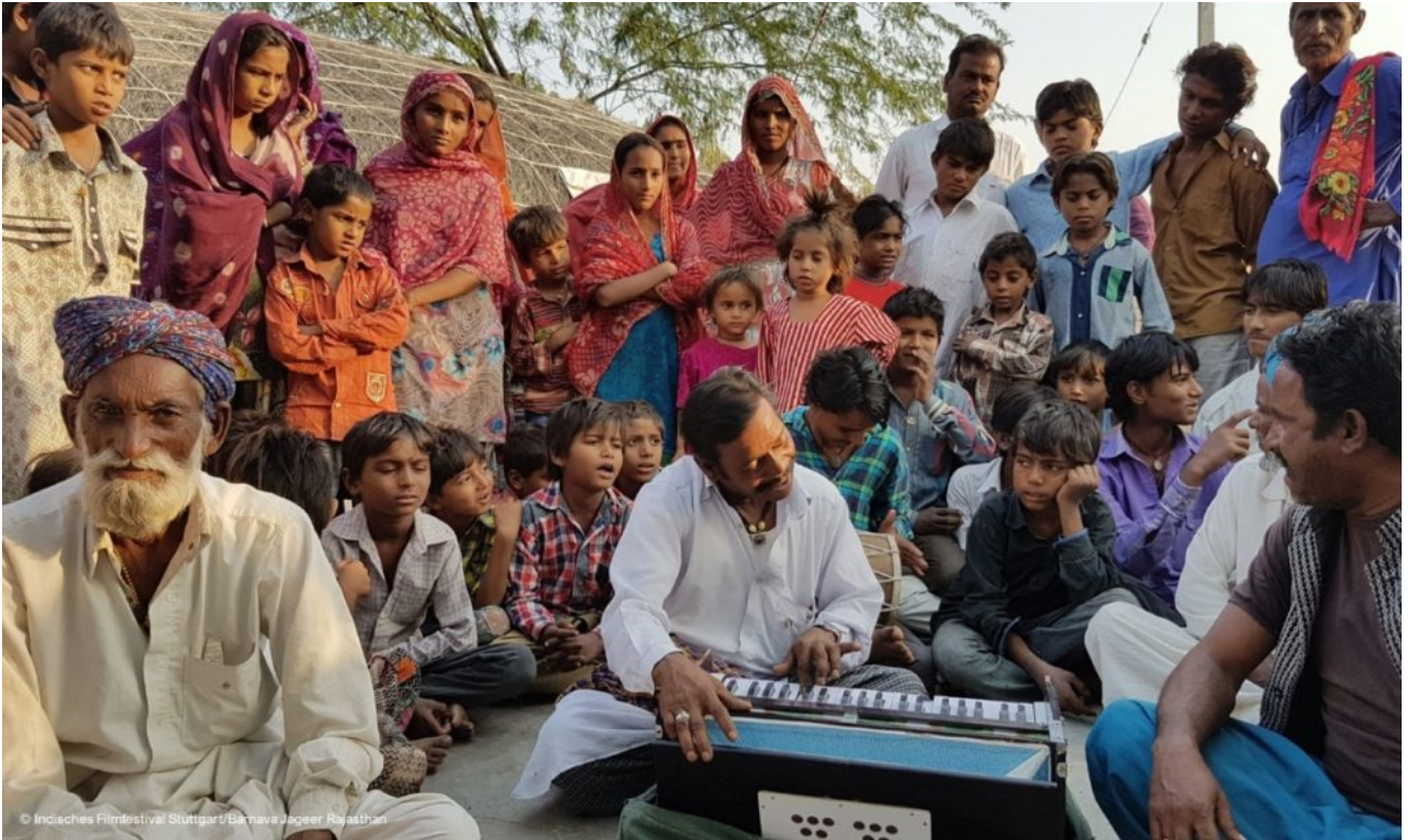
Filmstill aus „Barnava Jageer Rajasthan“

„Tanishka“ von Sudeep Sohni ist den prägenden Jahren im Leben eines Künstlers gewidmet – der Kindheit. Er erforscht die Seele einer Achtjährigen, die Bharatanatyam lernt, einer der acht klassischen Tanzstile in Indien, dessen Wurzeln in der südindischen Tempelkultur liegen. Die Erzählung des Films, die in nicht-linearer Form aufgebaut ist, zeigt ihr tägliches Leben, ihre Umgebung, ihre Reisen und ihre Auftritte.