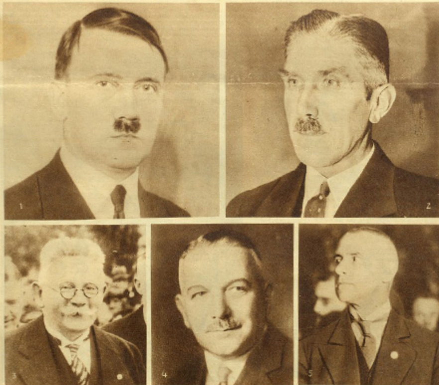
1. Der an die Spitze der deutschen Regierung berufene Reichskanzler Adolf Hitler. — 2. Stellvertreter des Reichskanzlers und Reichskommissar für Preußen Franz v. Papen. — 3. Reichswirtschaftsminister Dr. Alfred Hugenberg. — 4. Reichsaußenminister von Neurath. — 5. Innenminister Dr. Wilhelm Frick. Taxistreik in Wien. — Gschnasrevue. — Kampf um das Erdöl.