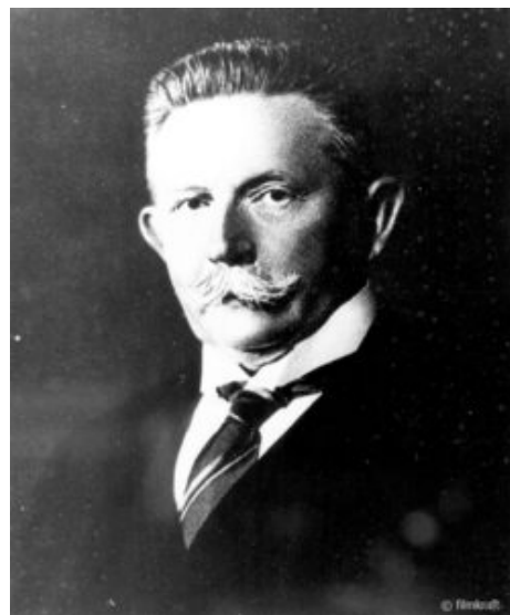
Portrait Alfred Hugenberg

Heller: In den 1970er Jahren hatte ich schon Erfahrungen gemacht mit Recherchen nach historischem Material für meine beiden Kolonialfilme „Liebe zum Imperium“ (1978) und „Usambara – Das Land, wo Glaube Berge versetzen soll“ (1980). Beide Filme sind in weiten Teilen Kompilationsfilme mit viel Archivmaterial. Deswegen besuchte ich alle möglichen Archive in London, Washington, Sansibar, Nairobi, Daressalam und war im Bundesarchiv in Koblenz und im Staatlichen Filmarchiv der DDR. So kannte ich die Bestände ziemlich gut, welche Filme aus den 1920er Jahren es dort noch gab. Das Filmmaterial war in Büchsen und es gab dazu Karteikarten zum Inhalt. Die hatte ich damals abgeschrieben und so auch andere Themen zur deutschen Geschichte miterfasst.