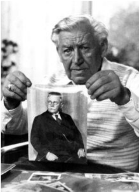
Setzer mit Foto von Hugenberg