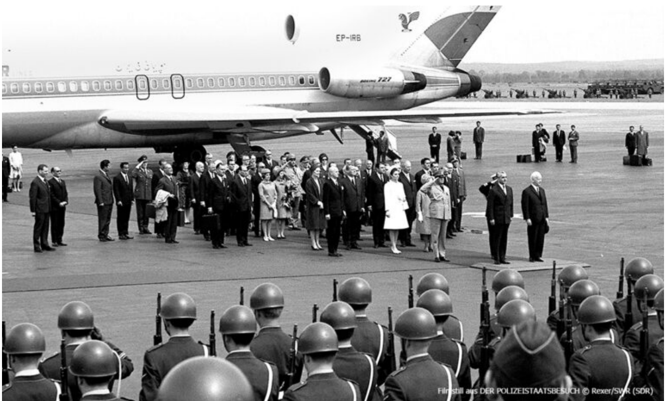
Filmstill aus DER POLIZEISTAATSBESUCH

Ich habe diesen nur 45 Minuten langen Film 1988 in einer Wiederholung im Fernsehen gesehen, zu einer Zeit, als es jeden Abend genau drei Kanäle gab: ARD, ZDF und ein Drittes Regionalprogramm. Ich war 21 Jahre alt, hatte gerade ein Angebot als Regieassistentin beim Theater abgelehnt, weil ich