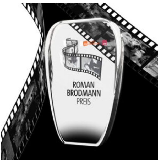
Roman Brodmann Preis