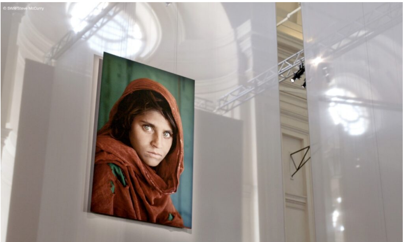
Das Mädchen mit den grünen Augen © SWR/Steve McCurry

„Rocco und seine Brüder“ ist ein anonymes Künstler-Kollektiv, das in der Graffiti-Szene von Berlin aktiv ist. Bekannt ist es vor allem für politisch motivierte, radikale und oftmals provozierende Kunst im öffentlichen Raum. In „Rocco und seine Brüder – Radikale Aktionskunst aus Berlin“ geben sie Einblicke in ihre Arbeit und die Berliner Graffiti-Szene. Ausgestrahlt wird die Doku am 2. August 2023 um 01:20 Uhr im RBB und ist außerdem in der ARD-Mediathek verfügbar.