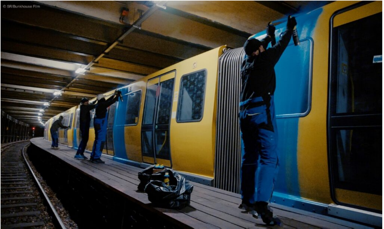
Das Künstler-Kollektiv Rocco und seine Brüder