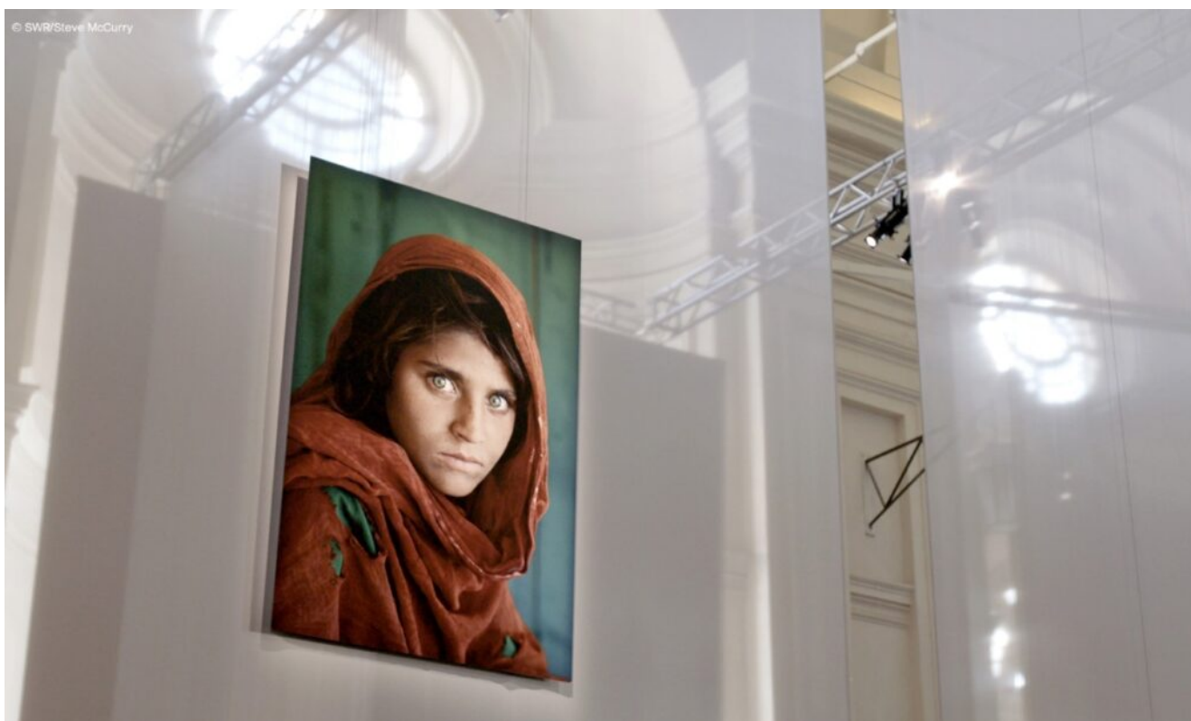
Das Mädchen mit den grünen Augen

„Rocco und seine Brüder“ ist ein anonymes Künstler-Kollektiv, das in der Graffiti-Szene von Berlin aktiv ist. Bekannt ist es vor allem für politisch motivierte, radikale und oftmals provozierende Kunst im öffentlichen Raum. In „Rocco und seine Brüder – Radikale Aktionskunst aus Berlin“ geben sie Einblicke in ihre Arbeit und die Berliner Graffiti-Szene. Ausgestrahlt wird die Doku am 2. August 2023 um 01:20 Uhr im RBB und ist außerdem in der ARD-Mediathek verfügbar.