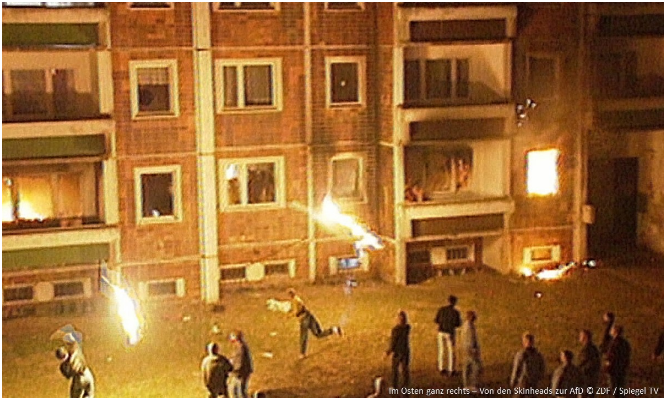
Im Osten ganz rechts – Von den Skinheads zur AfD