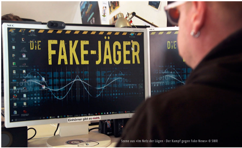
Szenen aus »Im Netz der Lügen – Der Kampf gegen Fake-News«