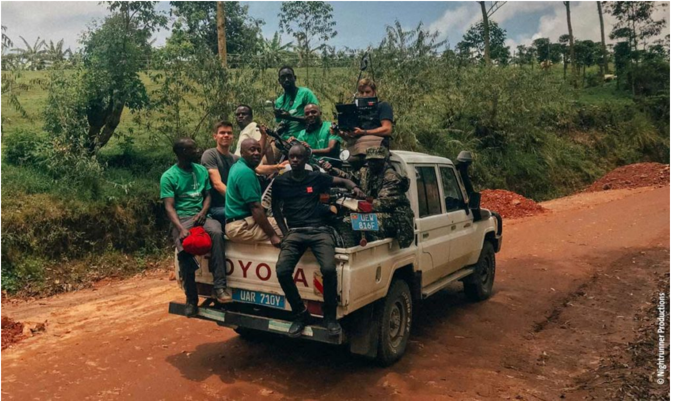
Hinter den Kulissen in Uganda.