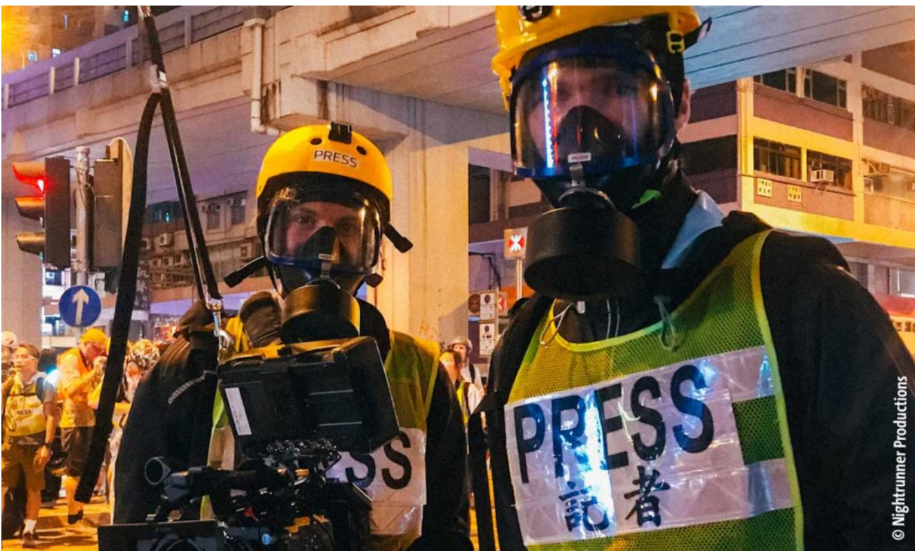
Hinter den Kulissen in Hongkong.