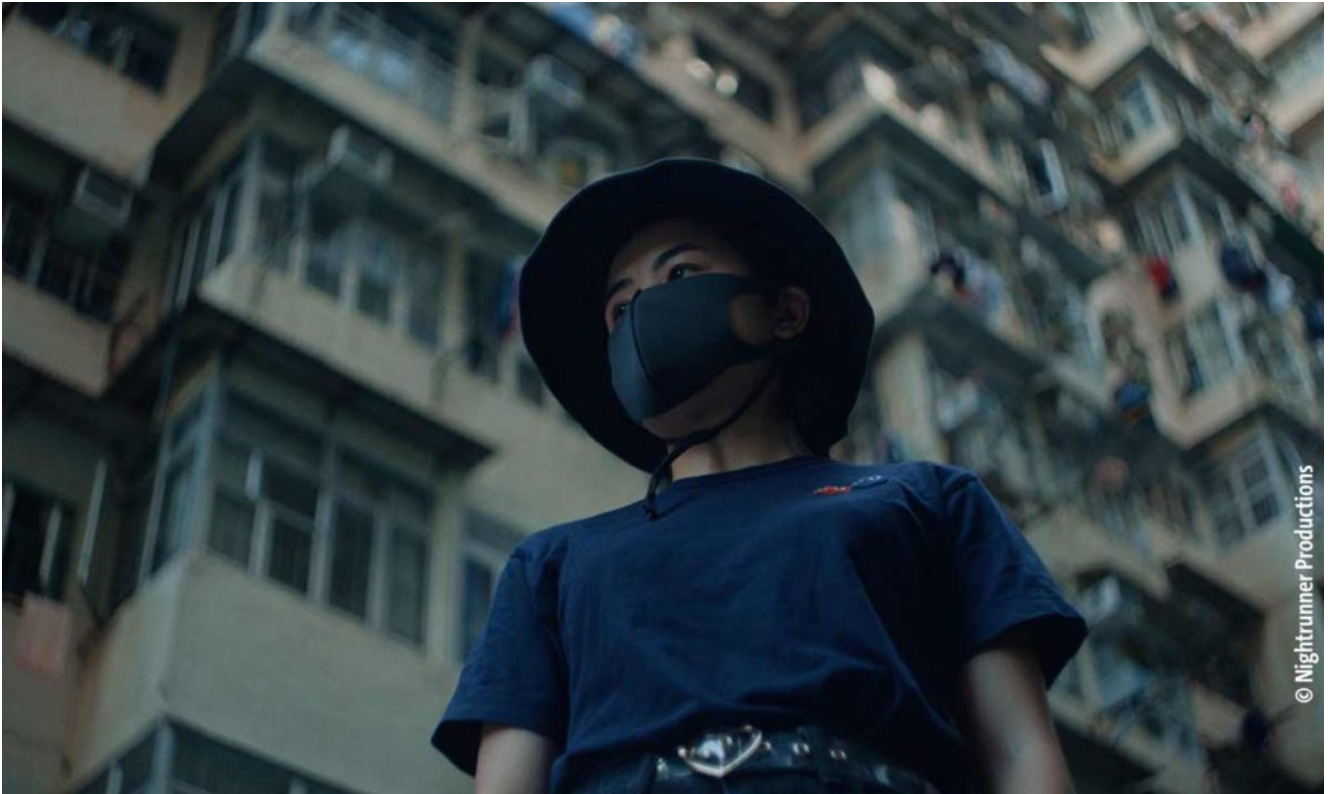
Pepper aus Hongkong.