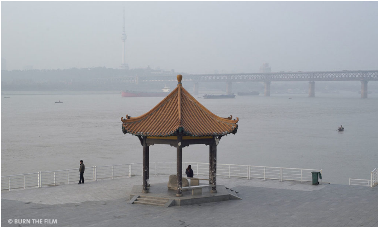
Filmstill aus "A River Runs, Turns, Erases, Replaces".