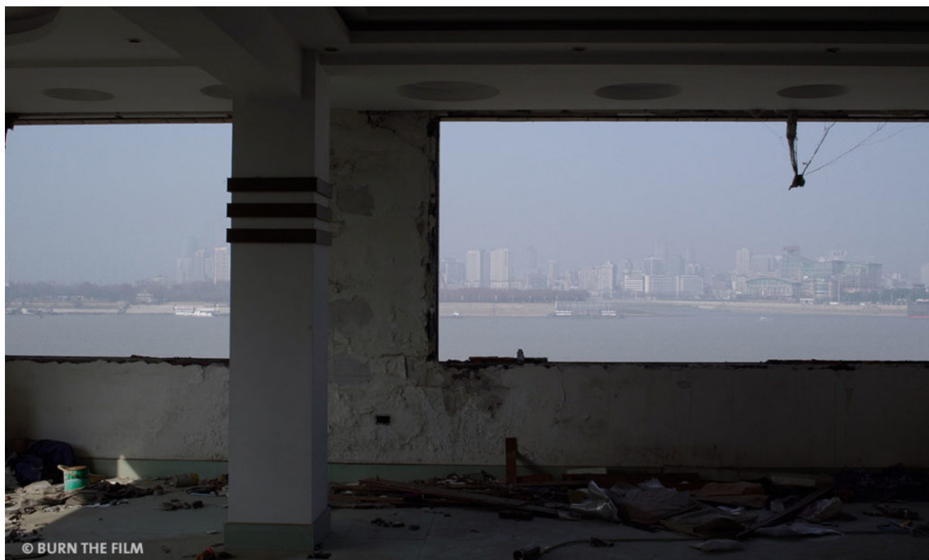
Wuhan als Ausbruchsort der Pandemie 2020.

Er beginnt mit Aufnahmen einer Überwachungskamera, die eine nahezu leere Straße im März und April 2020 zeigt. Die Straßenkehrer kommen regelmäßig und säubern den Gehweg. Am 4. April wird mit Sirenen das Gedenken an den Ausbruch eingeläutet. Die Menschen bleiben stehen, andere rennen herum, um den Moment in möglichst eindrucksvollen Fotos zu dokumentieren. Zentrale Einstellungen ist immer wieder der Fluss und die Baustellen der Stadt. Vier Briefe werden verlesen, die an einen Partner, an die Großmutter, den Vater und eine Tochter gerichtet sind, die der Pandemie zum Opfer fielen. Dies macht sehr subtil aufmerksam auf die Verluste und darauf, dass nichts mehr so sein kann wie vorher.